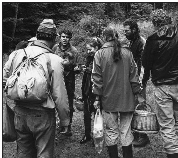
Mykologický průzkum v údolí Kobylská u Karolinky v roce 1994

Savci: velmi dobře jsou prozkoumány velké šelmy, u nich je přehled téměř o každé lokalitě výskytu. Dobře je známo rozšíření u všech větších lovných druhů a to díky velkému počtu myslivců, kteří velmi dobře znají poměry ve své honitbě. Je však nutné, aby zoologové jimi získané údaje průběžně podchycovali a důsledně vyhodnocovali. Např. v roce 1998 proběhl za spolupráce myslivců průzkum rozšíření jezevce lesního v okrese, který v rámci širšího regionu zajišťovala katedra zoologie z Přírodovědecké fakulty UP v Olomouci. Drobné zemní druhy savců jsou prozkoumány na několika stovkách lokalit, dosavadní znalosti o jejich rozšíření lze však vzhledem k jejich ekologii stále považovat za velmi nedostatečné. Netopýří fauna je dobře prozkoumána na zimovištích (s výjimkou puklin, kam se člověk nedostane), letní úkryty jsou známy jen útržkovitě. Při výzkumu letních kolonií je potřeba více zapojit laickou veřejnost, poněvadž netopýři v létě často přebývají v půdních prostorách rodinných domků, hospodářských budov a kostelů.