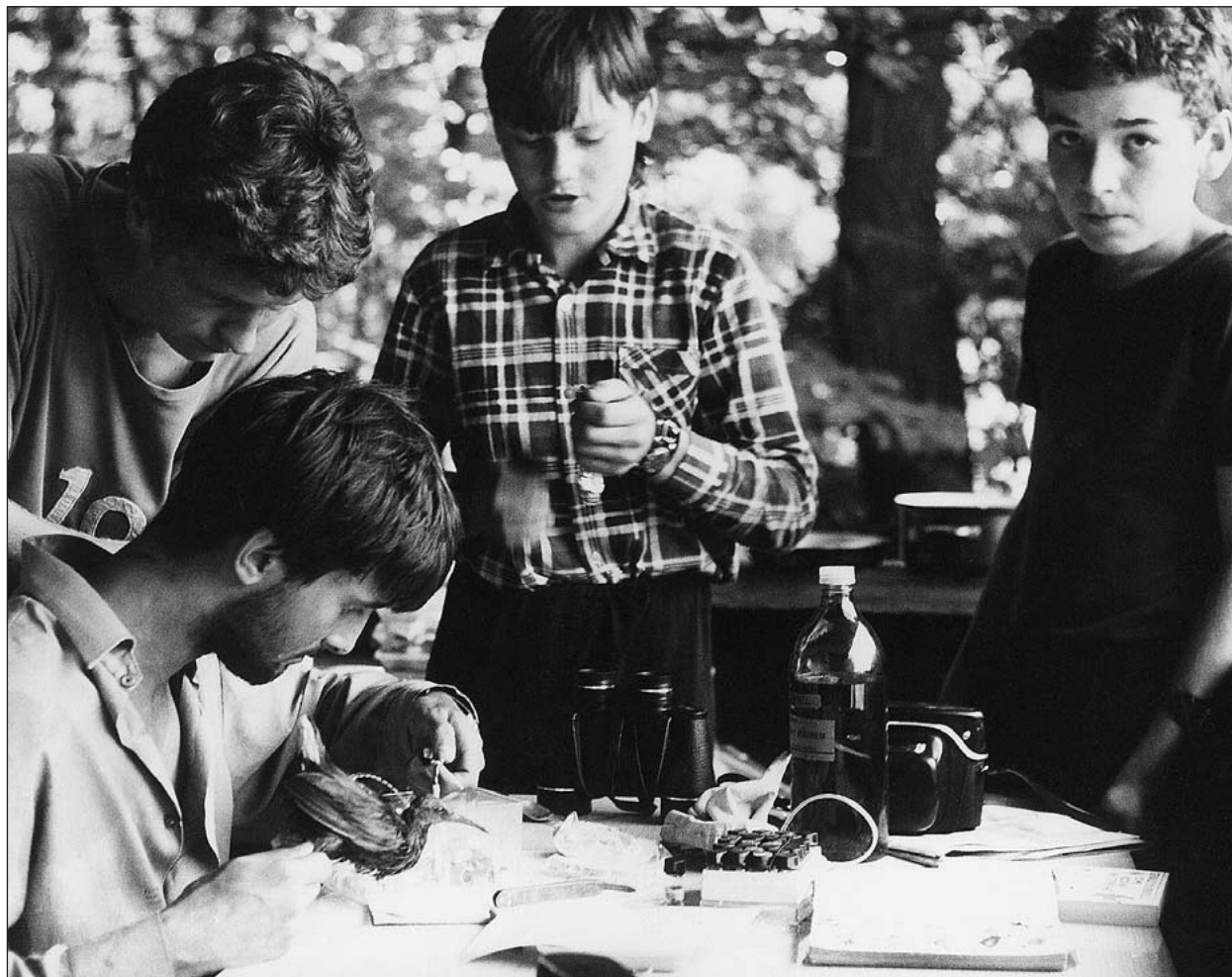
Kroužkování ptáků členy Valašského ornitologického klubu v roce 1986

V okrese také působila nebo působí řada jednotlivých odborníků z různých míst ČR, kteří sem příležitostně zavítají - jsou to nejčastěji specialisté na určité skupiny bezobratlých