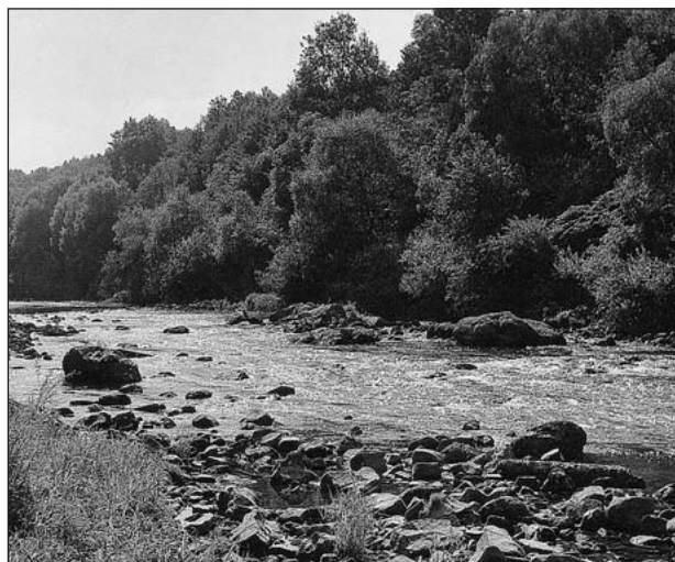
Bečva u Němetic - nejnižší místo v okrese Vsetín

O vysoké členitosti svědčí existence 1500 údolí, která jsou delší než 400 m, což představuje horizontální členitost 1,549 km/km 2 , to znamená, že na 1 km 2 připadá 1,549 km délky údolí.