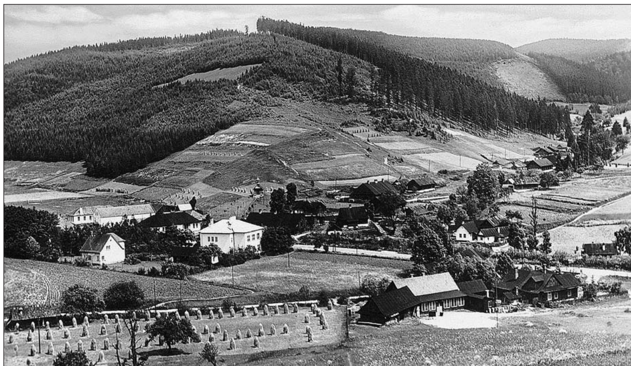
Pohled na údolí Léskové. Vpravo pohled do údolí Malá Hanzlůvka. V pozadí prales Razula. První polovina 20. století