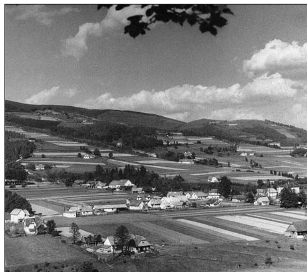
Archivní snímek obce Dolní Bečva z roku 1941

Poměrně známý a hojně navštěvovaný je skalní útvar Mečůvka jihozápadně od Velké Lhoty. Podle příkré ukloněných pískovců a slepenců rusavských vrstev vznikl stupňovitý, strukturně podmíněný mrazový srub délky 52 m a výšky 14 m. Skalní plochy jsou zvlněny množstvím vanovitých prohlubní, žlábkových pseudoškrápů, kulovitých dutin. Charakteristický je výskyt skalních mís (největší kruhovitá dosahuje průměru 60 cm a hloubky 20 cm).