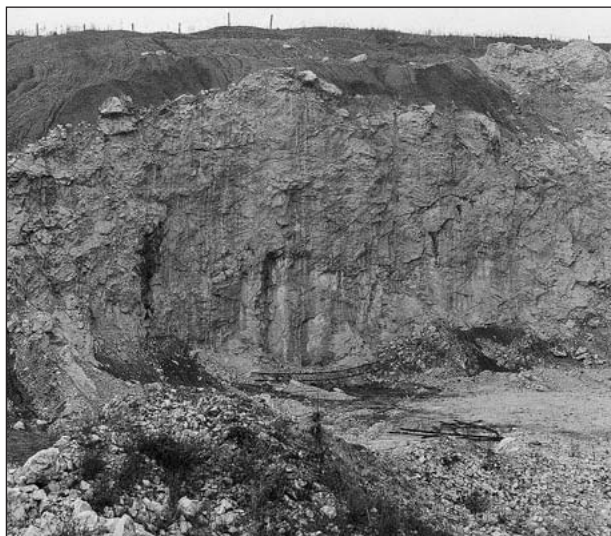
Vápencový lom v Jasenicích u Lešné

Uvedme jako příklad geografickou pozici prvohorních karbonátových uloženin (vápenců a dolomitů), které sice nevycházejí na území okresu na povrch, ale byly doloženy ve velkých hloubkách ve vrtu Jablůnka 1 u Vsetína. Zjištěné teplovodní organismy, především koráli, lilijice, břichonožci a další, bezpečně dokládají vznik těchto sedimentů v tropickém klimatickém pásmu. Metodicky náročné paleomagnetické výzkumy (studují orientaci magnetického pole Země v geologické minulosti) tento předpoklad potvrdily. Skutečná pozice tohoto okraje dnešní severoevropské platformy s karbonátovou sedimentací však byla na jižní polokouli, přibližně na 11° jižní šířky.