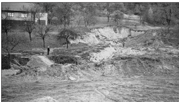
Sesuv v Jarcové z roku 1997

V průběhu středního pleistocénu - rissu před 300 - 128 tisíci lety, dosáhly již krajinné tvary rysů shodných s dnešním povrchovým reliéfem a rovněž základní říční sít, především v horské části území, odpovídala dnešnímu stavu. Moravskoslezské Beskydy však tvořily bariéru proti průniku kontinentálního ledovce hlouběji do vnitrozemí. V období elsterského a sálského zalednění (před 700 - 128 tisíci lety), kdy čelo ledovce dosáhlo severního okraje Beskyd, měla horská krajina charakter arktické a subarktické pouště a patrně existovala mocná vrstva trvale zmrzlé půdy - permafrostu. Podle velmi hlubokého založení některých fosilních sesuvů v hloubce několika desítek metrů, můžeme nepřímou odvozovat i hloubku tohoto promrzání. Tyto zvodnělé masy deluviálních svahových sedimentů se dávaly opakovaně do pohybu v teplejších obdobích. Hluboké mrazové zvětrávání mělo za následek sjíždění velkých ker sedimentů, původně tektonicky rozvolněných, za vzniku mrazových srubů, blokových sesuvů a pestré škály pseudokrasových jevů. Horské zalednění nejvyšších partií nebylo jednoznačně prokázáno, ale jeho existence v malém rozsahu na nejvyšších vrcholech v ledových obdobích je možná.