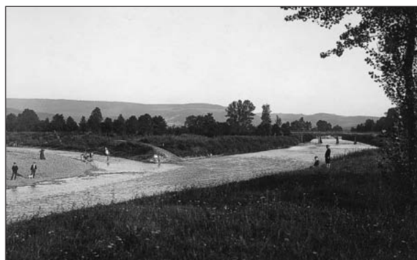
Soutok Vsetínské a Rožnovské Bečvy z roku 1930

Ve starších pracech se předpokládalo, že zbytky tohoto nejstaršího zarovnaného povrchu se nachází jako plošiny a ploché hřbety v nejvyšších polohách Javorníků, (např. oblast Stolečného vrchu 956 m, Kohútky 913 m), Vsetínských